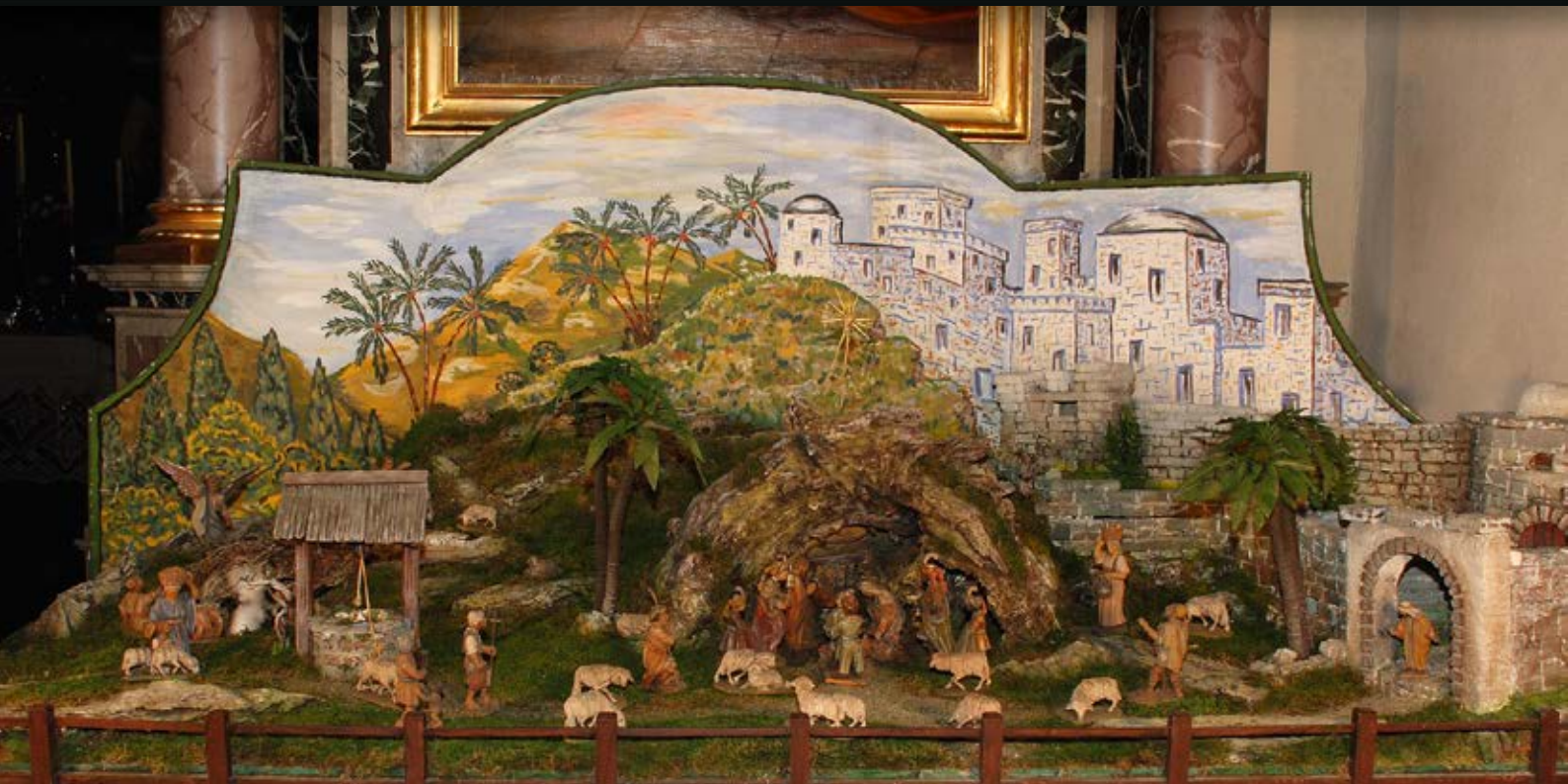
Kirchenkrippe Oberlienz / Krippenberg: von Johann Schneeberger (Zeiner Hansl) im Jahr 1955 gebaut / Figuren: Holz gefasst von Zeiner Hansl Hintergrundbild: Öl auf Holz von Alois Girstmair (Krippele Lois) / Der Krippenberg wurde in den 1990er-Jahren teilweise zerstört und vom Krippenverein Nußdorf-Debant wieder restauriert / Krippengröße: B 225, T 80, H 50 cm.