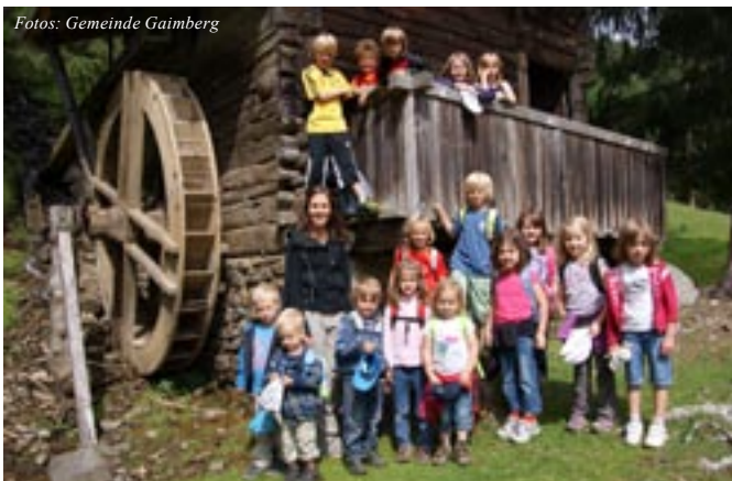
Die Kinder genossen sichtlich die zahlreichen Ausflüge in die freie Natur