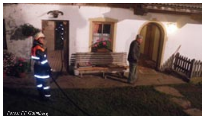
Innenangriff mittels HD-Rohr