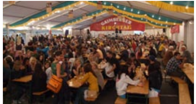
Bereits um 20:30 Uhr war das Festzelt voll