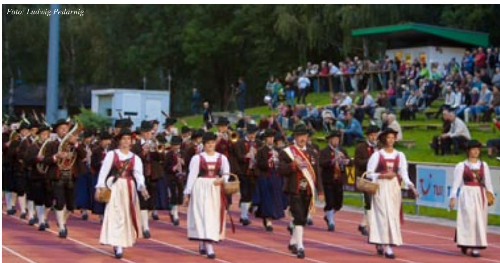
Die MK Gaimberg bei der Marschmusikbewertung im Dolomitenstadion Lienz