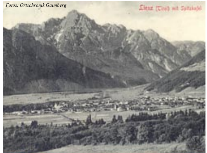
Der Blick auf Lienz von 1908 zeigt einen Teil des hauptsächlich mit Erlen bewaldeten Schuttkegels, den der Grafenbach gebildet hat. In der Mitte die Michaelskirche, weiter links der Rufenfeldweg

Sperren hinunterschaut, der kommt zur Überzeugung, dass große Leistungen vollbracht wurden, um die darunter liegenden Siedlungen und deren Bewohner zu schützen.