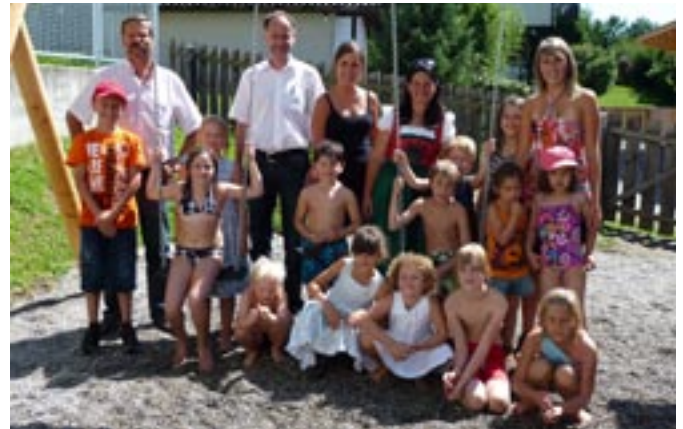
Zum Abschluss besuchten auch die beiden Bürgermeister von Oberlienz und Thurn sowie die Bürgermeisterin von Gaimberg die Kinder der Sommerbetreuung

Die restlichen drei Wochen verbrachten wir im Kindergarten Gaimberg. Dort machten wir den Bauernhof zum Thema. Durch das wöchentli-