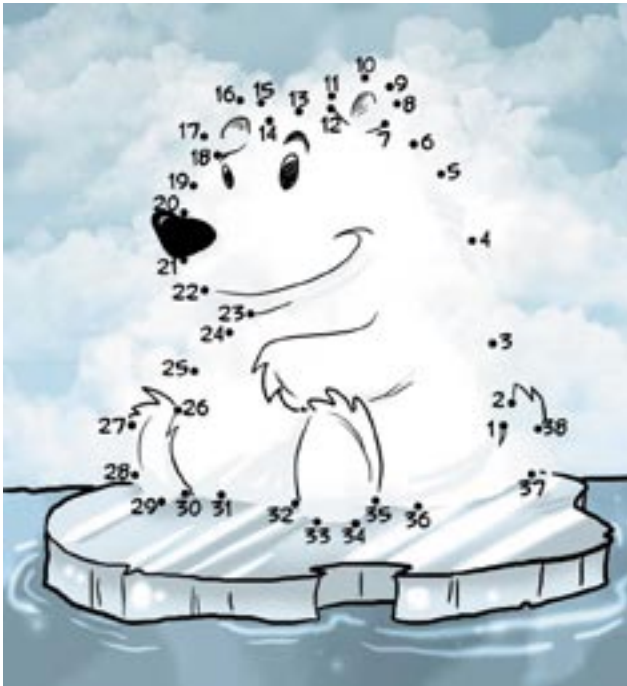
Malst du mich an?