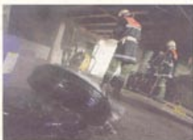
Der Rauch drang auch in die Garage und die Wohnräume.