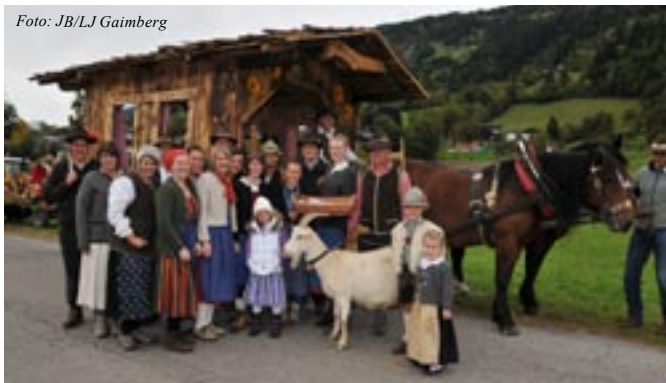
Bezirkslandjugendtag 2011 mit Erntedankumzug

landeten Innervillgraten und Thurn. Nach dem offiziellen Teil wurde der Landjugendball eröffnet. Dabei wurde