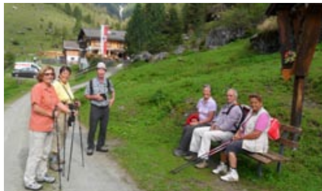
Nicht mehr weit zur „Stoan-Alm“