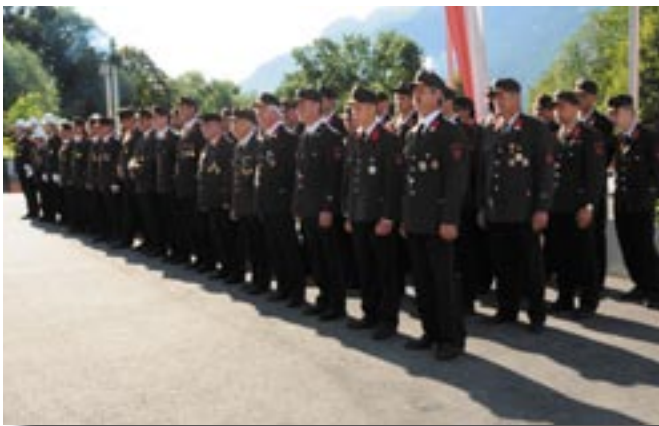
Die Jubiläumsfeuerwehr mit Abordnungen aus den Nachbargemeinden