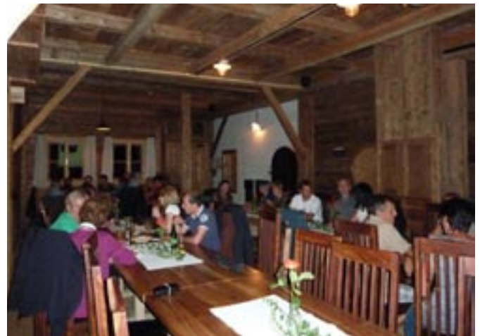
Besucher des Vortrages im Mesner Brennstadl