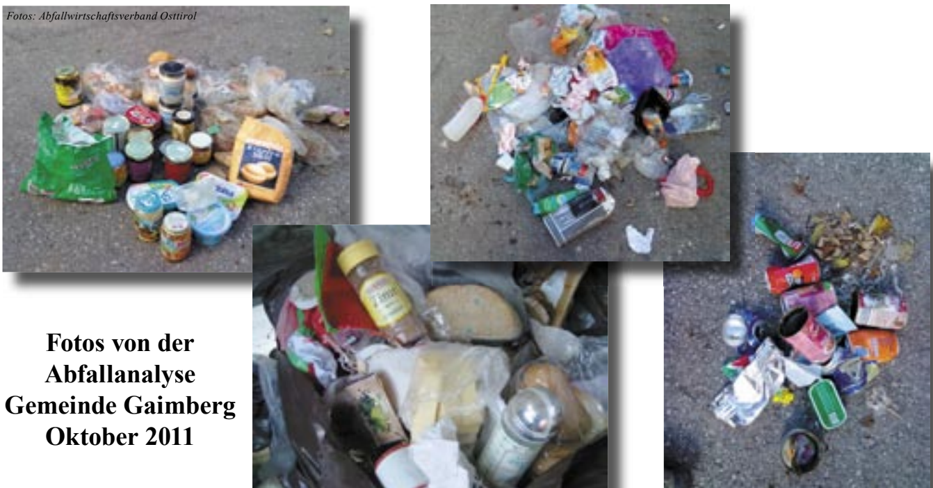
Fotos von der Abfallanalyse Gemeinde Gaimberg Oktober 2011