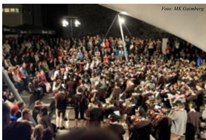
Das Konzert „Sonnendörfer grüßen die Sonnenstadt“ fand vor einer tollen Kulisse im Borg-Areal statt

Die Zusammenarbeit der drei an der Sonnenseite von Lienz gelegenen Gemeinden wird schon seit mehreren Jahren gepflegt, zum Beispiel in Form von einem gemeinsamen Internetauftritt ( www.sonnendoerfer.at ) und einem gut ausgebauten Wanderwegenetz, den Sonnenwegen. Nach einigen Austauschkonzerten der Musikapellen in den vergangenen Jahren entschloss man sich im Jahr 2011 für ein größeres gemeindeübergreifendes Projekt. Unter dem Titel „Die Sonnendörfer grüßen die Sonnenstadt Lienz“ wurde am 6. August 2011 in der Lienzener BORG-Arena ein gemeinsames Konzert veranstaltet. Nicht Konkurrenzdenken und