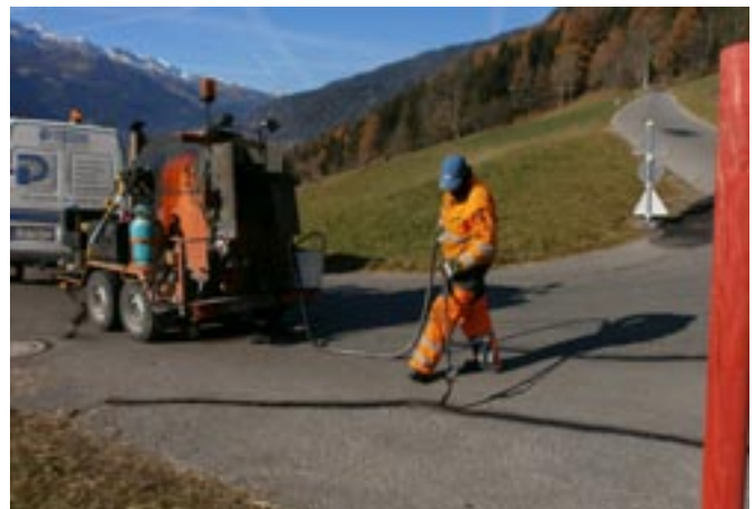
Sanierungsarbeiten Gemeindefraße (Obergaimberg)