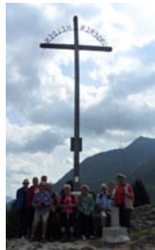
Rast beim Heldenkreuz

ungsspaziergang um den See war nicht falsch, bevor wir uns auf dem Heimweg noch in das Nobelhotel „Zedernklang“ wagten. Die Chefin lud sogar zum Kaffee in die exquisite Bar ein, zu einem moderaten Preis für uns „neugierigen“ Leut'.