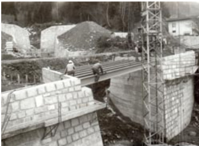
Neubau der Egger Brücke; im Hintergrund die große Sperre für das Ausschotterungsbecken