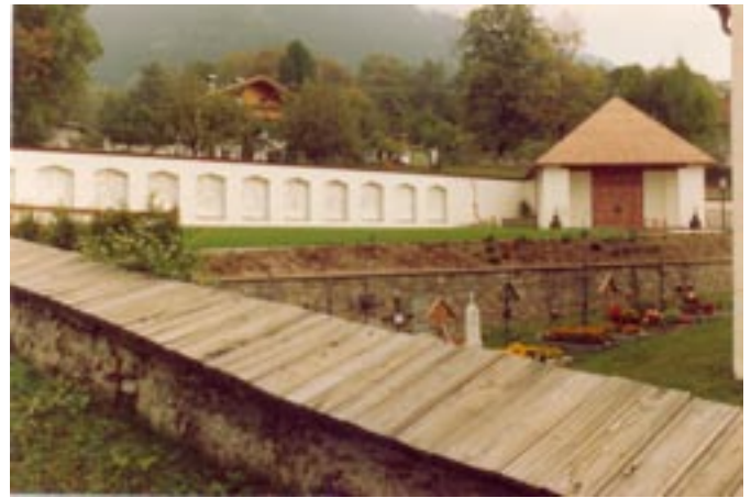
Friedhof nach der Erweiterung

Die Anlage zog berechtigt Exkursionen an und wurde mit ehrlichem Lob bedacht. Das Regenwetter am Weihetag konnte die feierliche Stimmung nicht vermindern, als der Lienzer Dekan Josef Huber den erweiterten Friedhof