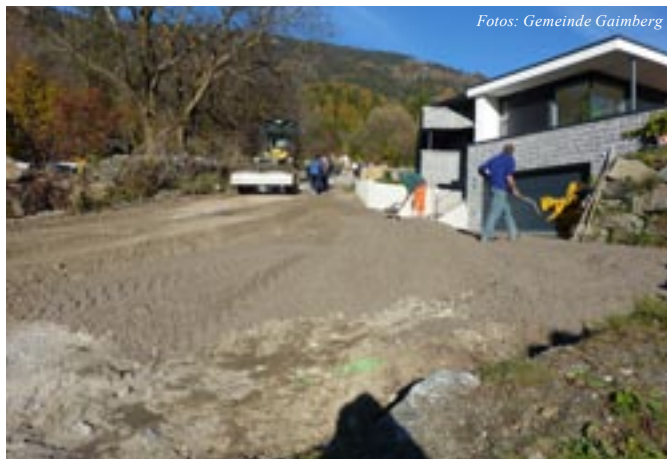
Sanierungsarbeiten Gemeindefraße (Wartschensiedlung)