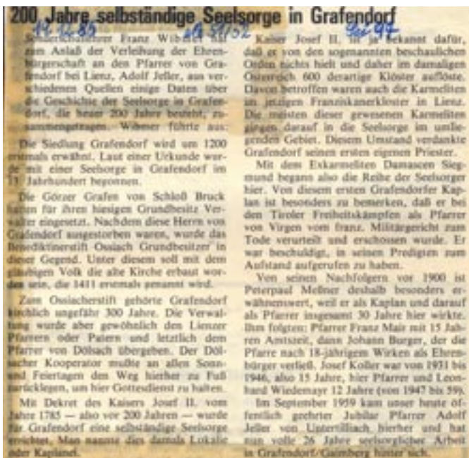
1. Zeitungsbericht unseres derzeitigen Ortschronisten Franz Wibmer von 1986