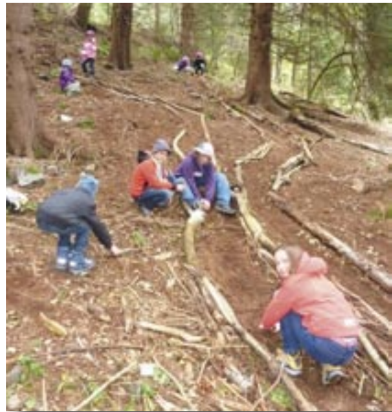
Im „Jahr des Waldes“ verbrachte die 1. Klasse einen Projekttag im Wald. Die Kinder suchten mit Hilfe von Becherlupen nach den ganz kleinen Tieren im Wald, bestimmten das Alter der Bäume und hatten Spaß an verschiedenen Waldspielen. Mit besonderem Eifer bauten die Kinder Kugelbahnen. Die Spannung stieg, als sie zum Abschluss ausprobiert wurden und es hieß: „Auf die Plätze, fertig, los!“