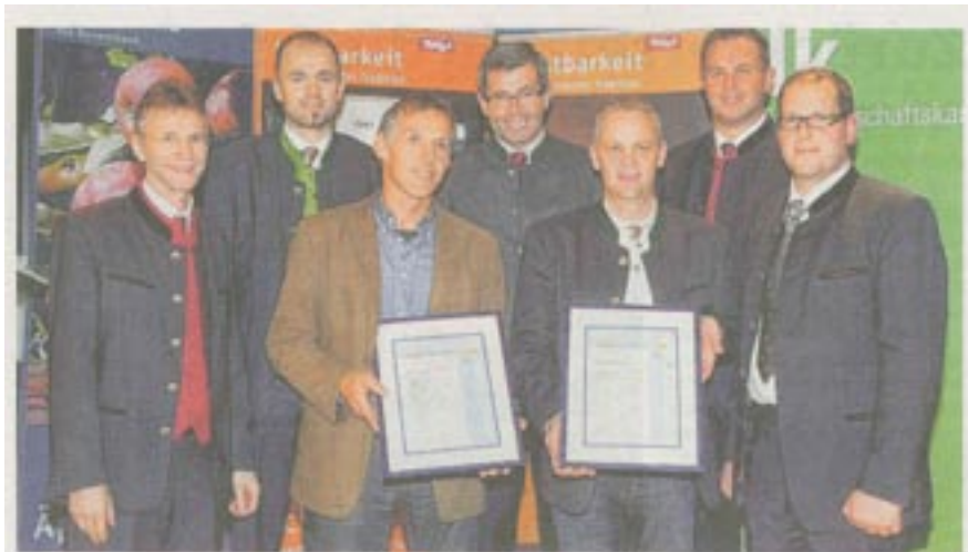
Gratulierten den Prämierten aus dem Bezirk: Hechenberger, Juen und LHstv. Steixner.