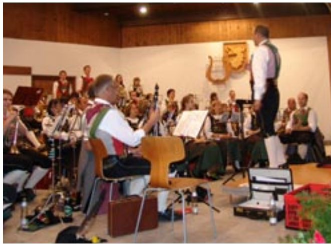
Die MK Schlaiten musiziert in Gaimberg

Seit seiner Segnung und erstmaligen Benützung am 3. Juli 2004 stellt der Pavillon in Gaimberg mit seinem Vorplatz eine Bereicherung für die kulturelle Infrastruktur der Gemeinde dar. Beispielhaft war die Errichtung. Unter der Trägerschaft der Gemeinde Gaimberg hat die Musikkapelle das Bauvorhaben in kurzer Zeit und mit einem hohen Einsatz von unentgeltlich erbrachten Arbeitsleistungen umgesetzt. Neben den Musikantinnen und Musikanten stellten viele weitere Gaimberger ihre Können und ihr Engagement für dieses Projekt zur Verfügung. Heute kann, nach etwas mehr als fünf Jahren der Nutzung, sehr zufriedenstellend festgestellt werden, dass sich der Einsatz und die Mühen gelohnt haben. Nicht weniger als 21 Blasmusikkonzerte haben im Pavillon, der von vielen Fachleuten wegen seiner guten Akustik und seines großzügigen Platzangebotes geschätzt wird, bereits stattgefunden. Die guten örtlichen und baulichen Voraussetzungen machen es möglich, dass Gastkapellen gerne nach