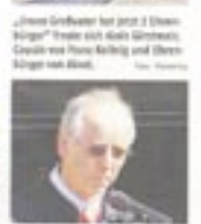
Bürgermeister Franz Klauerer...