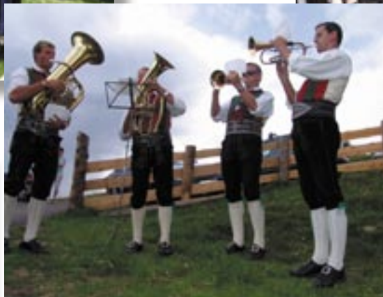
...Weisenbläser bei der Mecki's Panoramastuben auf dem Zet- tersfeld