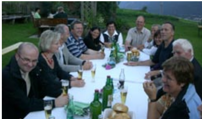
Geselliges Beisammensein beim Freimannhof mit den Gästen aus Garsten

Der Kirchtag 2008 stand ganz im Zeichen der Musikkapelle und ihres Jubiläums. 2009 war die Freiwillige Feuerwehr an der Reihe, und der Gaimberger Kirchtag hatte wiederum einiges zu bieten. Bei prachtvollem Wetter wurde das neu errichtete Feuerwehrgerätehaus gesegnet und seiner Bestimmung übergeben. Spannend blieb es bis zuletzt, öffnete doch am Tag vor der