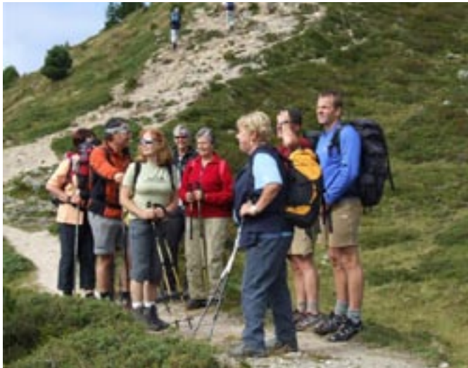
Ein Teil der Wandergruppe beim Wandertag in Südtirol