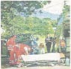
Retter bei der Erstversorgung an der Unfallstelle.

Im Spital endete für einen Motorradfahrer (50) am Samstag in Gaimberg die Begegnung mit einem VW-Bus. Als die Fahrzeuge einander in einer nicht einsehbarsten Kurve entgegenkamen, behielten beide Lenker eine Vollbremsung ein. Dabei kippte der Biker, prallte gegen die Motorhaube und kam unter dem Bus an dem Vorderreifen zu liegen. Der Chassisler (50) erlitt einen Beckenbruch.