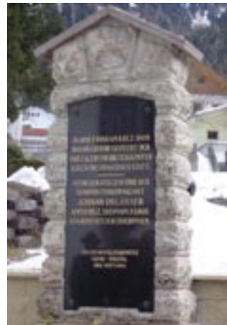
Das Denkmal steht an der Hinrichtungsstätte beim Aineter Hof