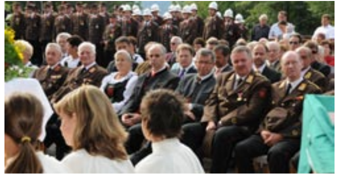
Ehrgäste bei der Segnung des neuen Feuerwehrhauses

KRISTINA PRANTER-KREUZER (KLEINE ZEITUNG V. 25.08.2009)