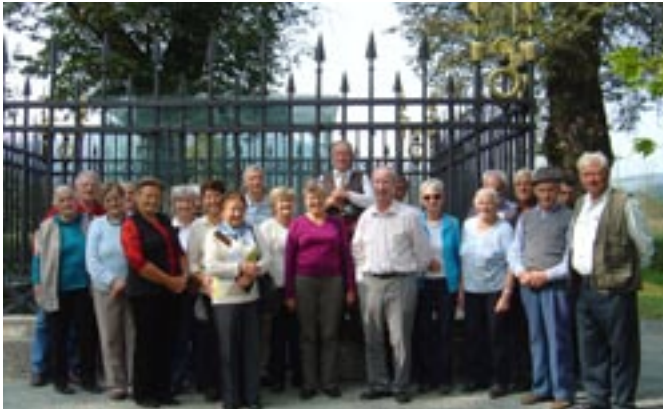
Bei der Besichtigung des Herzogstuhls