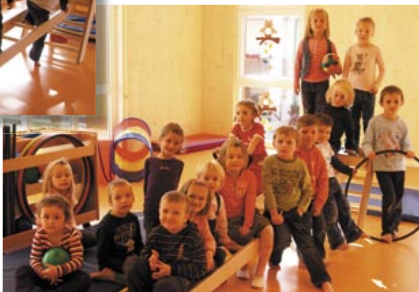
Die Kindergartenkinder beim Herumtollen im neuen „Bewegungsraum“