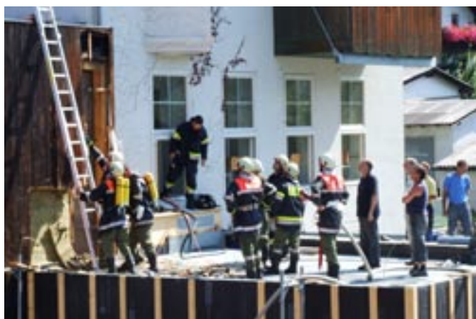
Feuerwehr beim Löschen des Brandes beim Gemeindehaus

Unsere Feuerwehr und zwei Gruppen der Feuerwehr Thurn waren stundenlang damit beschäftigt, mehrere überflutete Keller auszupumpen, mit Schotter verunreinigte Straßen zu säubern und