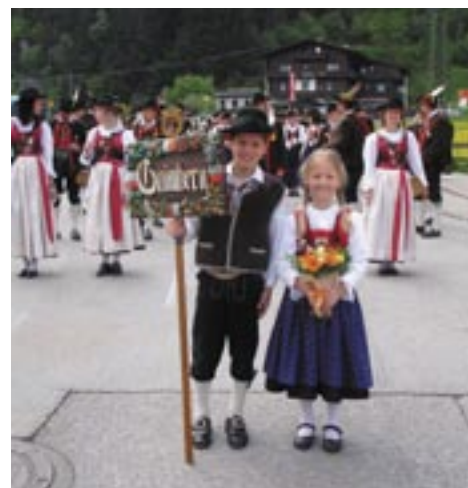
Die MK Gaimberg beim heurigen Gau- derfest in Zell im Zillertal