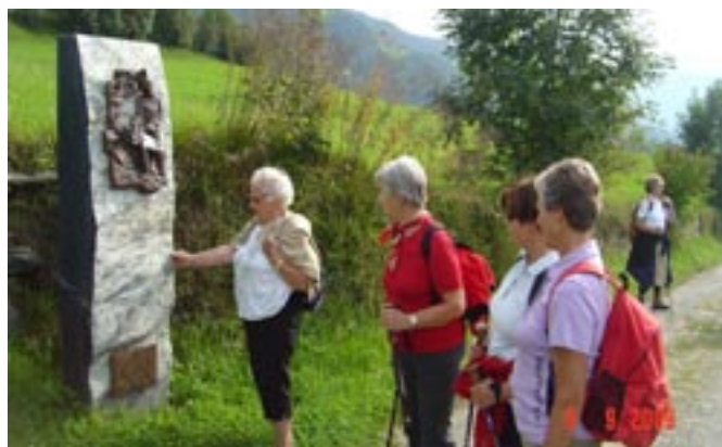
Geistige Auffrischung am Kreuzweg nach Obermauern