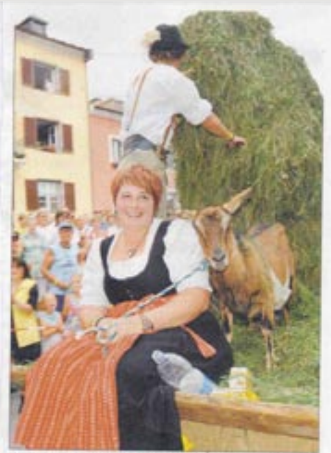
24 Gruppen zogen beim Umzug durch die Stadt.