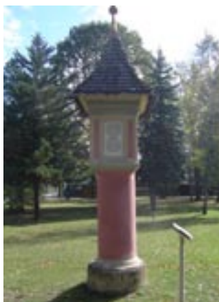
Die Verschonung Tristachs ist auf dem Bildstöckl am Ortseingang verewigt