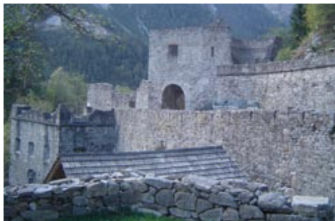
An der Lienzert Klause konnte ein Vorstoß der französischen Truppen abgeblockt werden

Dezember 1805 bei Austerlitz einen grandiosen Sieg gegen Österreich und Russland feiern konnte, musste Kaiser Franz I. härteste Bedingungen annehmen und im Frieden von Pressburg den Verlust von Tirol und Vorarlberg akzeptieren. Als Belohnung für das Bündnis wurde Tirol im Jänner 1806 bayrischer Besitz. Napoleon war es dabei auch darum gegangen, die strategisch wichtigen Alpenpässe im Besitz eines treuen Bundesgenossen zu wissen. Das Tiroler Gebiet wurde auf 3 bayrische Provinzen aufgeteilt, und der Name Tirol absichtlich ausgelöscht. Innsbruck verlor seine Bedeutung als Landeshauptstadt. Unser Bereich fiel an den Eisackkreis. An den Lienzertoren prangte nun das bayrische Wappen. Die Einverleibung