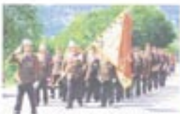
Die Feuerwehr Gaimberg mit Fahnen bei der Beisetzung...