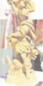
Das Bild ist ein Bild von Franz...