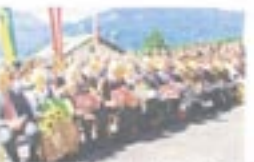
Die lange erste Reihe der Österringer bei der Beisetzung...