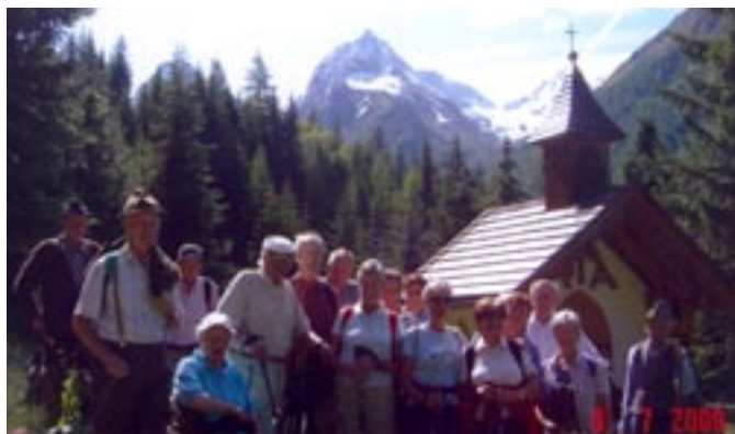
Bei der Marienkapelle mit Blick auf Gant und Hochschober

Drei Wandertage haben heuer im Sommer den Senioren zu schönen gemeinsamen Erlebnissen verholfen. Das Interesse war jedes Mal groß, ist es doch eine gute Möglichkeit, die Naturschönheiten der näheren Heimat erleben und genießen zu können. Viele unserer Senioren stellten ihre sportliche Fitness