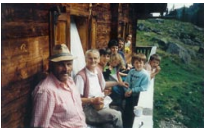
Erholsame Tage auf der Gasslbodenhütte