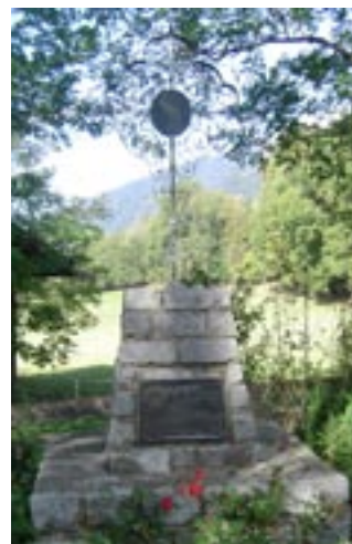
Hier beim „Franzosenkreuz“ ist es auch zu Kämpfen gekommen

am 29. Dezember vor seinem Haus hingerichtet und über der Haustüre aufgehängt. Im Garten der Angerburg, derzeit sogen. Integrationshaus, hinter dem Kloster, starben die beiden Geistlichen (Pfarrer und Kooperator) aus