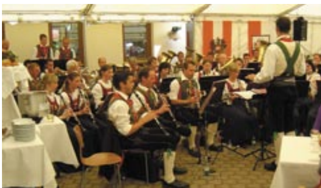
Über viele Jahre hindurch hat die Musikkapelle Gaimberg zur Freude der Seniorinnen und Senioren im Wohn- und Pflegeheim Lienz konzertiert. Heuer kamen am 14. Juni erstmals die BewohnerInnen des Altenheimes in Matriei in diesen Genuss.